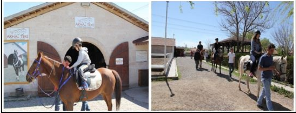
Foto 3: Akhal Teke at çiftliğinde kısa süreli atlı doğa yürüyüşü turuna hazırlanan atlar ve turistler.

Nevşehir’de bu malzemeleri yapan usta da kalmadı”. K6, “atlı doğa yürüyüşleri yaparken mutlaka koruyucu başlık takılmalı ve güvenlik yeleşgi giyilmelidir”.