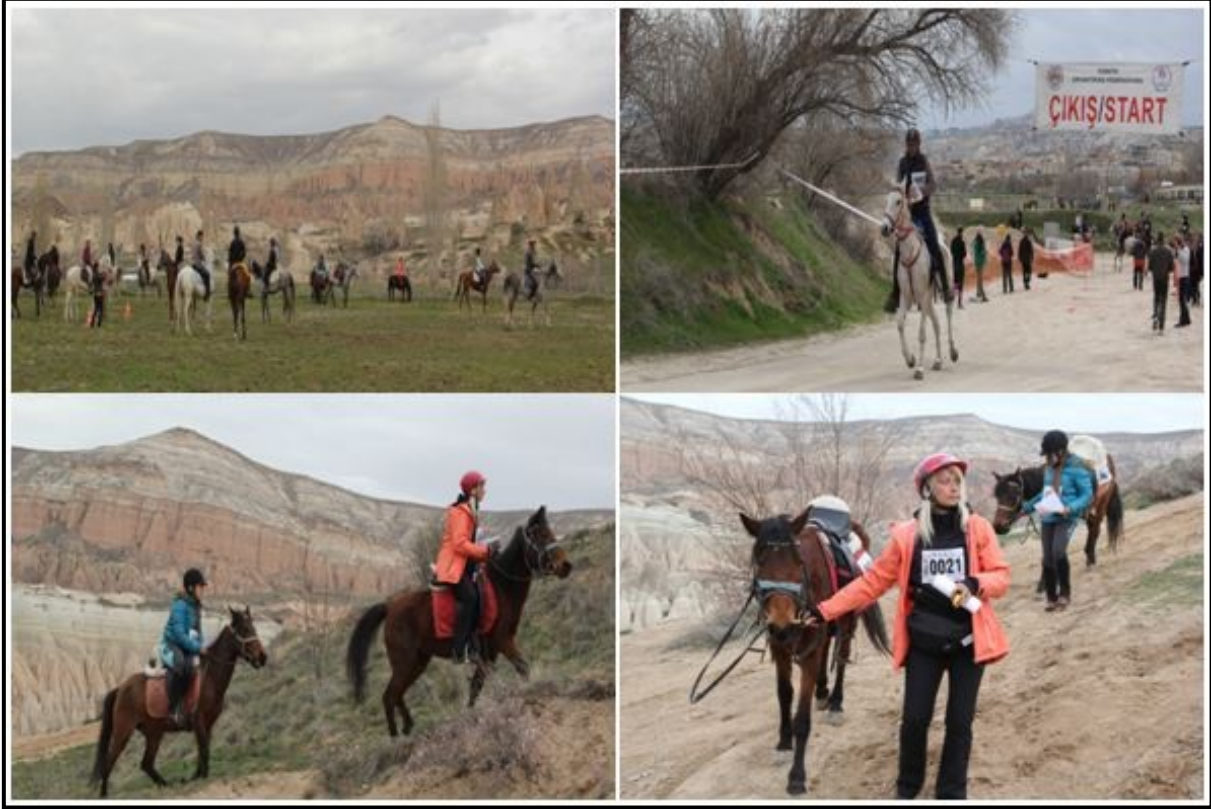
Foto 4: 27 Mart 2015'te Göreme'de gerçekleştirilen atlı oryantiring yarışına katılan sporcular.