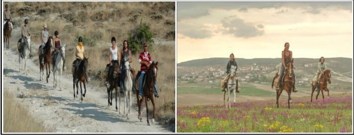
Foto 2: Atlı doğa yürüyüşüne katılan turistler (Kirkir Horse Riding, 2015).

binicilik eğitimi almış olmak gerekmektedir. Daha çok Avrupalı turistler küçük gruplar halinde konaklamalı birkaç günlük atlı turları tercih ederler” şeklinde görüş belirtmiştir.