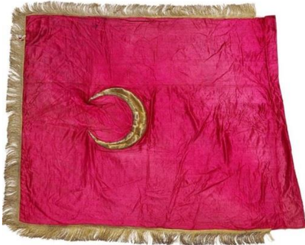
Osmanlı Devlet Sancağı