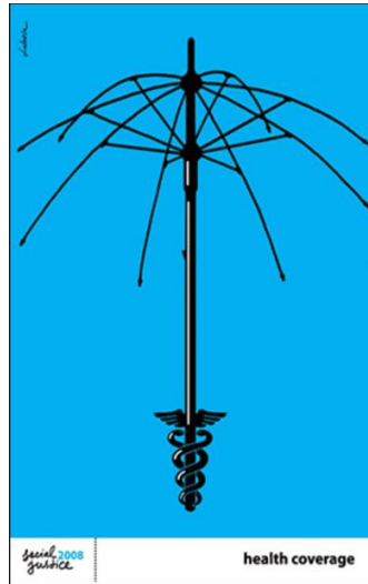
Görsel 8. İllüstrasyon, Luba Lukova.

Kontrast, ön plan, arka plan gibi kavramlar, vurguyla birlikte anılması gereken görsel tasarım kurallarındandır (Uçar,2019:271). Afiş tasarımı incelendiğinde vurgu 3/2'lik alanda afişin üst kısmında konumlandırılan figür ve dallarındadır. Yapraklarla anlam pekişmesi sağlanan görselde, 3/1'lik alanda yer verilen ağaç gövdesi vurgusal olarak ikinci plandadır. Afişte arka planın tek renk olarak kullanılması ile oluşan keskin ayırım algılanırlığı arttırmaktadır.