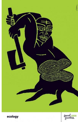
Görsel 6. İllüstrasyon, Luba Lukova.

Tırnaksız (serifsiz) yazı karakterlerinin temiz çizgileri modern olarak değerlendirilirken, tırnaklıların (serifli) daha geleneksel oldukları düşünülür (Ambrose ve Harris, 2018,46). Afişte serifsiz font kullanımı modernlik algısı yaratmanın yanı sıra oluşturulan metin bloğu ile de tasarım yüzeyinde denge kurulmasına yardımcı olmuştur.