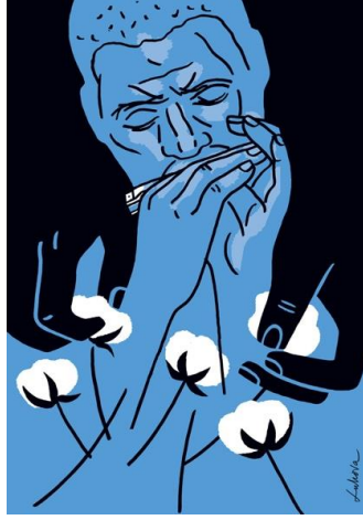
Görsel 3. İllüstrasyon, Luba Lukova.

Kelimeleri yazmaya ek olarak, yazı aynı zamanda içerdiği harflerin anlamlarından çok görsel temsilleri üzerinden iletişim kuran bir grafik araç olarak da kullanılır (Ambrose ve Harris, 2018:164). Afişte serifsiz kullanılan yazı fontundaki “o” harfi ile klozetin şekilsel benzeşmesinden doğan kurgu tasarımda göze çarpmaktadır. O harfinin görsel temsili, bir diğer tasarımsal unsur ile şekilsel benzeşmeye geçerek grafik bir araca dönüşmüştür.