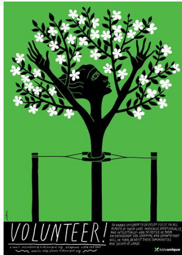
Görsel 5. İllüstrasyon, Luba Lukova.

Dengedeki bir nesne insanlara sabit, tanıdık görünür ve stres yaratmaz; bu yüzden tasarımda dengenin menmuniyet vericidir (Arıkan, 2009:46). Bir görsel unsurun tasarım içindeki diğer unsurlarla kurduğu orantısız ilişki, algı ve iletişimi doğrudan etkilemektedir (Becer, 2013:68). Afişte kurulan denge ile algılamada kolaylık, estetiklik ve sağlıklı bir iletişim sağlanmıştır.