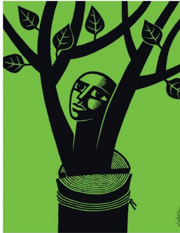
Görsel 7. İllüstrasyon, Luba Lukova.

Grafik tasarımcı kavramsal çözüm, tipografi, kompozisyon gibi pek çok sorun ile başa çıkmaya çalışırken bir taraftan da renk öğesini tasarımın bir elemanı olarak oluşturmak durumundadır (Uçar,2019:109). Çünkü renk de bir tasarım öğesidir. Renk ve tonları tasarım yüzeyindeki tipografi ve diğer görsel unsurların görünürlüğünü, algılanırlığını etkiler. Bazı görsel unsurları ön plana çıkarırken bazı unsurları geri iter. Bu yüzden afiş tasarımlarında tercih edilen renk faktörü diğer öğe kullanımları kadar dikkat ve bilinç gerektirmektedir. Ayrıca renk, anlamsal olarak bazı kavramlara da karşılık gelmektedir, bu sebeple bir tasarım elemanı olması bağlamında sembolik öğe olarak kullanımına dikkat edilmelidir.