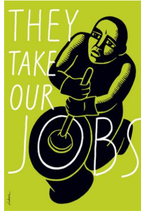
Görsel 2. İllüstrasyon, Luba Lukova.

Tasarımda tipografi farklı bir tasarım alanı olarak değerlendirebileceği gibi, görselle ilişkisi üzerinden hem metnin somutlaştırılması hem de göstergebilimsel potansiyelleri açısından değerlendirilebilmektedir (Örücü,2023: 289). Afişte besin değeri tablosunda besin değerlerinin sıfır olarak ifade edilmesi göstergebilimsel olarak açlık kavramına karşılık gelmektedir, figürün ağız kısmına konumlandırılması ile de anlam pekişmesi sağlanmıştır.