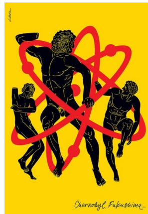
Görsel 4. İllüstrasyon, Luba Lukova.

Renk, izleyicide duygusal tepki uyandırma yeteneği sebebiyle ana bir tasarım öğesidir. Renkler “soğuk”, “sıcak” veya “heyecan verici” gibi duygu ifade eden kelimelerle tanımlanır ve renklerin çoğu belli sıfatlarla ilişkilendirilir. Örneğin kırmızı genellikle sıcak veya heyecan verici renk olarak tanımlanırken, mavi soğuk ve mesafelidir (Ambrose ve Harris, 2020:106). Lukova, mavi, siyah ve beyaz renkleri kullandığı bu afişte mızıkça çalan bir köleyi stilize etmiştir. Renk kullanımları değerlendirildiğinde izleyiciye olumsuz bir durum çağrışımı, soğuk bir konunun ele alındığı mesajı iletilmektedir.