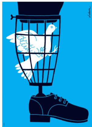
Görsel 10. İllüstrasyon, Luba Lukova.

İletici izleyiciye aktarabilmek için imgenin genellikle kısa bir zamanı vardır bu nedenle anlamı daha hızlı ve etkin bir biçimde iletmek için çeşitli araçlar kullanır. Bu sembolizm, metafor, benzetme, tipogram ya da bir takım başka yöntemler kullanılarak gerçekleştirilebilir (Ambrose ve Harris, 2013:67). Afişte yer alan imgeler kastedilen mesajı izleyiciye metafor yoluyla aktarmaktadır. Sevginin, bağlılığın anlatısı olan el ele tutuşma eylemi bir hançer görseline maruz kalarak acı metaforuna dönüşmüştür. Hançer ve akan kan göstergesi olarak birbirine âşık iki insanın bu aşk uğruna çektiği acıyı aktarmaktadır. Lukova, manuscript font kullanımını tercih ettiği afiş tasarımında Romeo ve Juliet yazısı üzerine metaforik kanlar ekleyerek iki insanın acı çekme durumunu tipografi kullanımında pekiştirmiştir. Afişte siyah, beyaz, kırmızı renkler kullanılmıştır.