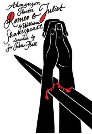
Görsel 9. İllüstrasyon, Luba Lukova.

siluet olarak kullanılan şemsiye, tasarım yüzeyinde akılda kalıcı şekilde sunulmuştur. Siluet kullanılarak nesnelere üzerinde egemenlik kurulmuş ve tutarlılık sağlanmıştır.