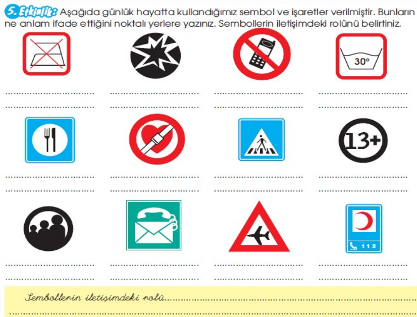
Şekil 7. MEB Yayınları'na ait İlköğretim Türkçe 7 Öğretmen Kılavuz Kitabı'nda yer alan bir etkinlikteki grafik simgeler (MEB, 2013f: 65)

Bahsi geçen kazanımlardan "Okuduklarını kendi hayatıyla ve günlük hayatla karşılaştırır." ile bağlantılı olarak kamusal alanlardaki grafik simgelerin öğretimine yönelik 1 etkinlik bulunmaktadır. Bu etkinlikte öğrencilerden, sunulan 12 grafik simgenin anlamını yazmaları ve grafik simgelerin iletişimdeki rollerini ifade etmeleri istenmektedir: