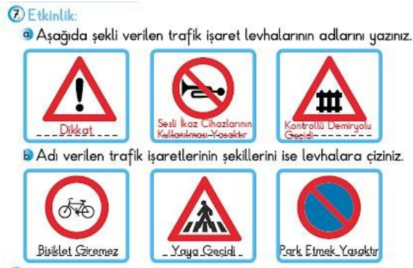
Şekil 2. MEB Yayınları'na ait İlköğretim Türkçe 2 Öğretmen Kılavuz Kitabı'nda yer alan bir etkinlikteki grafik simgeler (MEB, 2013b: 42)

Etkinliklere bakıldığında, öğrencilerin kamusal alanlarda karşılaşılabilecekleri grafik simgelerin bulunduğu 4 etkinlik tespit edilmiştir. Bu etkinliklerden birincisi, metnin görsellerinde yer alan ışıklı trafik cihazındaki renkler (kırmızı, sarı, yeşil) ile "Okul Taşıtı" mesajı ileten trafik işareti hakkındadır (MEB, 2013b: 40). İkinci etkinlikte, aşağıda yer alan 6 grafik simgenin öğretilmesi hedeflenmiştir: