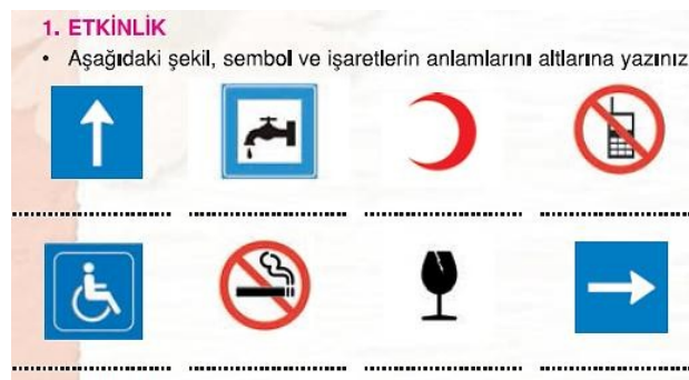
Şekil 4. Dörtel Yayıncılık'a ait İlköğretim Türkçe 3 Öğretmen Kılavuz Kitabı'nda yer alan bir etkinlikteki grafik simgeler (Karakuş, 2013a: 172)

Bahsedilen kazanımlar çerçevesinde 1 etkinliğin trafik lambalarındaki renkler (kırmızı, sarı, yeşil) ile iki trafik işaretinin anlamı hakkında olduğu belirlenmiştir. Bunun yanında kitapta, öğrencilerin trafik lambalarındaki renklerin anlamlarını araştırıp defterlerine yazmaları hakkında bir de yönlendirme yapılmıştır. Ayrıca 1 etkinlik aracılığıyla öğrencilerin kamusal alanlarda karşılaşılabilecekleri 8 mesaja yönelik grafik simgelerin öğretilmesi hedeflenmiştir. Bu grafik simgeler şunlardır: