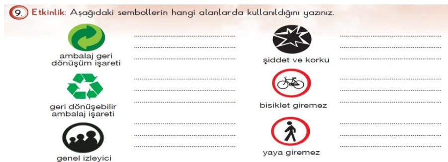
Şekil 5. MEB Yayınları'na ait İlköğretim Türkçe 5 Öğretmen Kılavuz Kitabı'nda yer alan bir etkinlikteki grafik simgeler (MEB, 2013d: 195)

Bu kazanımlar çerçevesinde, 6 grafik simgeden oluşan bir etkinlik mevcuttur. Bu etkinliğe göre öğrencilerden aşağıdaki grafik simgelerin ne anlama geldiğini ve hangi alanlarda kullanıldığını söylemeleri istenmektedir: