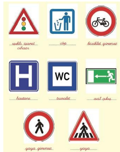
Şekil 1. Zambak Yayınları'na ait İlköğretim 1. Sınıf Türkçe Öğretmen Kılavuz Kitabı'nda yer alan bir etkinlikteki grafik simgeler (Bayındır, 2013: 259)

Kazanımlarla ilişkili etkinlikler incelendiğinde, öğrencilerin kamusal alanlarda karşılaşılabilecekleri grafik simgelerin bulunduğu 1 etkinlik tespit edilmiştir. Bu etkinlikle aşağıdaki 8 grafik simgenin öğretilmesi amaçlanmıştır: