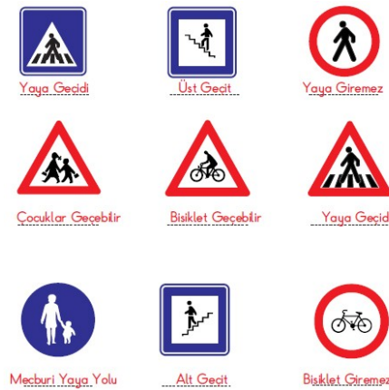
Şekil 3. MEB Yayınları'na ait İlköğretim Türkçe 3 Öğretmen Kılavuz Kitabı'nda yer alan bir etkinlikteki grafik simgeler (MEB, 2013c: 34)

Dörtel Yayıncılık'a ait İlköğretim Türkçe 3 Öğretmen Kılavuz Kitabı'nda (Karakuş, 2013a) "Şekil, sembol ve işaretlerin anlamlarını bilir." ve "Görsellerden hareketle cümleler ve metinler yazar." kazanımları 4; "Trafik işaretlerinin anlamlarını bilir." kazanımı 1; "Renkleri tanır, anlamlandırır ve yorumlar." kazanımı 3 metinde geçmektedir.