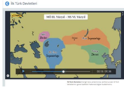
Fotoğraf 3. EBA’da 6.sınıf Sosyal Bilgiler Sekmesinde “Kültür ve Miras” Öğrenme Alanı İçerisinde Yer Alan Konu Anlatım Video Örneği

“Kültür ve Miras” öğrenme alanına ait EBA sitesinde bulunan videolar da görsellerde gösterildiği üzere canlı ve dikkat çekici nitelikler barındırmaktadır. 1,30 dakikayı geçmeyecek kısıklıkta anlatımlar hâkimdir. Videoların sağ alt köşesinde videoların neyi anlatmak istediği kısa açıklamalarla belirtilmiştir. Videolar, sol üst köşede de gösterildiği üzere bir eğitim sitesi olan ‘Vitamin’ adlı siteden alınmıştır.