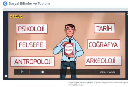
Fotoğraf 6. EBA’da 6.sınıf Sosyal Bilgiler Sekmesinde “Bilim, Teknoloji ve Toplum” Öğrenme Alanı İçerisinde Yer Alan Konu Anlatım Video Örneği

insanlarının yer aldığı bir videonun eklenmesi içeriğin zenginleştirilmesi ve eksikliğin karşılanması açısından önem arz etmektedir. Diğer kazanımlara ait ders videoları ise kazanımda geçen ifadeleri karşılar niteliktedir.