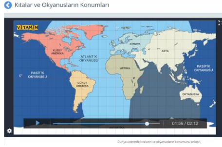
Fotoğraf 4. EBA’da 6.sınıf Sosyal Bilgiler Sekmesinde “İnsanlar, Yerler ve Çevreler” Öğrenme Alanı İçerisinde Yer Alan Konu Anlatım Video Örneği