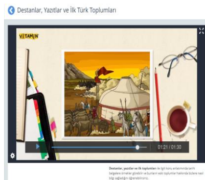
Fotoğraf 2. EBA'da 6.sınıf Sosyal Bilgiler Sekmesinde "Kültür ve Miras" Öğrenme Alanı İçerisinde Yer Alan Konu Anlatım Video Örneği