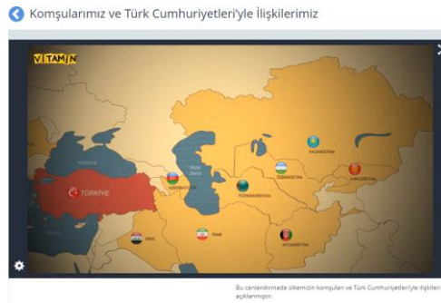
Fotoğraf 12. EBA’da 6.sınıf Sosyal Bilgiler Sekmesinde “Küresel Bağlantılar” Öğrenme Alanı İçerisinde Yer Alan Konu Anlatım Video Örneği

Tablo 15’de de gösterildiği gibi 6.Sınıf Sosyal Bilgiler dersi öğretim programında “Küresel Bağlantılar” öğrenme alanına ait 4 kazanım yer almaktadır. 1. kazanıma ait 3 konu anlatım videosu varken diğer kazanımlara ait 1’er tane konu anlatım videosu yer almaktadır. “SB.6.7.4. Popüler kültürün, kültürümüz üzerindeki etkilerini sorgular. Kültürümüze ait olmayan unsurların, medya araçları yoluyla toplum hayatını nasıl etkilediği fark ettirilir.” kazanımı bağlamında kültürümüze ait olan ve olmayan öğelerin video şeklinde sunulması ve diğer kazanımlara ait konu anlatım videolarının çoğaltılmasının gerekliliği dikkat çekmektedir.