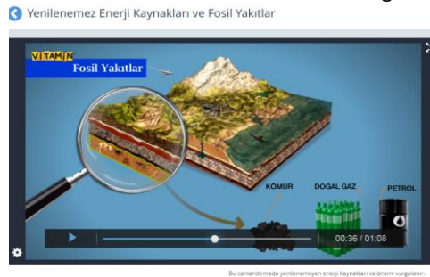
Fotoğraf 9. EBA’da 6.sınıf Sosyal Bilgiler Sekmesinde “Üretim, Dağıtım ve Tüketim” Öğrenme Alanı İçerisinde Yer Alan Konu Anlatım Video Örneği