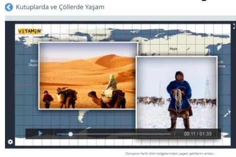
Fotoğraf 5. EBA’da 6.sınıf Sosyal Bilgiler Sekmesinde “İnsanlar, Yerler ve Çevreler” Öğrenme Alanı İçerisinde Yer Alan Konu Anlatım Video Örneği

“İnsanlar, Yerler ve Çevreler” öğrenme alanına ait sunulan video görsellerinde de görüldüğü üzere harita üzerinden yapılan anlatımlar sayesinde öğrencilerin konuyu daha açık ve anlaşılır halde öğrenmelerine imkân sağlanmıştır. Video süreleri yine 1-2 dakikayı geçmeyecek uzunlukta kısa ve öz anlatımlıdır. “Vitamin” adlı eğitim sitesinden alınan bu ders videolarının görüntü ve ses kalitesi bakımından öğrencilerin gelişim seviyesine uygun yapıda olduğu söylenebilmektedir.