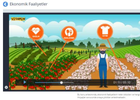
Fotoğraf 8. EBA’da 6.sınıf Sosyal Bilgiler Sekmesinde “Üretim, Dağıtım ve Tüketim” Öğrenme Alanı İçerisinde Yer Alan Konu Anlatım Video Örneği

Tablo 13 EBA’ da yer alan 6.sınıf Sosyal Bilgiler dersi “Üretim, Dağıtım ve Tüketim” öğrenme alanına ait konu anlatım videoları ile 6. sınıf Sosyal Bilgiler dersi Öğretim Programı’ndaki kazanımların karşılaştırmasını göstermektedir. Programda “Üretim, Dağıtım ve Tüketim” öğrenme alanına ait 6 kazanım yer almaktadır. İkinci kazanıma ait konu anlatım videoları diğer kazanımlara oranla daha fazladır. Toplamda ise bu öğrenme alanına ait 9 adet konu anlatım videosu bulunmaktadır. Videoların tamamı incelendiğinde 6.Sınıf Sosyal Bilgiler Dersi Öğretim Programında yer alan kazanımları EBA’da bulunan ders videolarının karşıladığı görülmektedir.