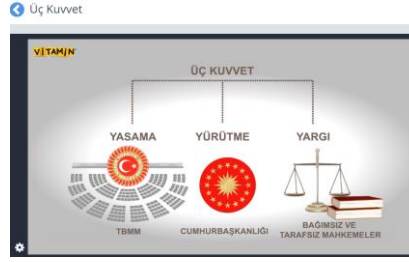
Fotoğraf 10. EBA’da 6.sınıf Sosyal Bilgiler Sekmesinde “Etkin Vatandaşlık” Öğrenme Alanı İçerisinde Yer Alan Konu Anlatım Video Örneği