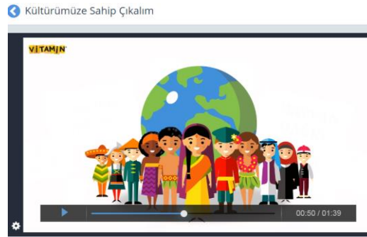
Fotoğraf 13. EBA’da 6.sınıf Sosyal Bilgiler Sekmesinde “Küresel Bağlantılar” Öğrenme Alanı İçerisinde Yer Alan Konu Anlatım Video Örneği

“Küresel Bağlantılar” öğrenme alanına ait sunulan video görsellerinde de görüldüğü üzere yukarıda incelenen 6 öğrenme alanına ait videolarda olduğu gibi “Küresel Bağlantılar” öğrenme alanına ait videolarda da 2-3 dakikayı geçmeyen anlatımlar ve renkli görseller barındıran, sıkıcılıktan uzak ve dikkat çekici görseller kullanılmıştır. Öğrencilerin gelişim seviyelerine uygun, görüntü ve ses kalitesi yüksek içeriklerdir. Ve bir eğitim sitesi olan ‘Vitamin’ adlı siteden alınmış içeriklerdir. Kazanımlar dışında bilgi kirliliği yaratacak unsurlara rastlanmamıştır. Bu nedenle öğretim programıyla uyumlu olduğu tespit edilmiştir.