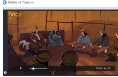
Fotoğraf 11. EBA’da 6.sınıf Sosyal Bilgiler Sekmesinde “Etkin Vatandaşlık” Öğrenme Alanı İçerisinde Yer Alan Konu Anlatım Video Örneği

Öğrencilerin bilgileri anlamlandırabilmesi ve hafızasında kalıcı hale getirebilmesi için dersin görsellerle desteklenmesi gerekmektedir. Bu durum özellikle de ilkökul ve ortaokul seviyesindeki öğrenciler için oldukça önemlidir. Sosyal Bilgiler dersi de konuları bakımından soyut kavramlar barındırmaktadır. Ders videolarındaki görsel öğelerin kullanımıyla öğrencilerin zihninde canlanacak unsurlar sade, net ve anlaşılır olmalıdır. Fotoğraf 10 ve Fotoğraf 11’de görüldüğü üzere videolarda gözü yoran, bilgi karmaşası yaratan veya öğrencilerin anlamlandırmakta zorlanacağı herhangi bir olumsuz öğe bulunmamaktadır. Ayrıca ‘Kadın ve Toplum’ gibi sosyal konularda anlatımın hikâyeleştirilerek ve geçmişten günümüze kadar akış içerisinde sunulması öğrenci dikkatini ve konsantrasyonunu sağlamada etkili olmaktadır.