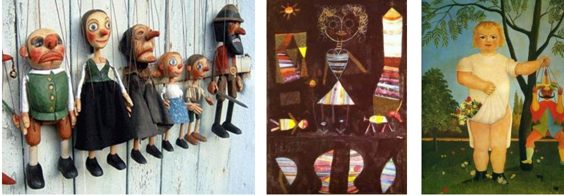
Görsel 7. Kukla Görsel 8. Kukla tiyatrosu (1923) P. Klee Görsel 9. Çocuk ile Kukla (1903) H. Rousse

Bez bebek, korkuluk ve kuklanın ilk üretim amacı birbirinden farklı olsa da zaman içinde oyun nesnesi ya da sanat imgesine dönüşmüşlerdir. Yapılış teknikleri malzemeleri açısından benzerlikler göstermektedir. Fizikler özellikleri de figür oluşturma bakımından da benzerlik oluşturmaktadır. Aslında bir arada düşünülmeyen bu üç nesne zaman içinde insanın yaratıcı zekâsı ile farklı amaçlara hizmet etmiştir. Sanat ürününde olduğu şekliyle oyuncakları da yaratıcı süreçten etkilenmişlerdir. Yaratıcılığın geliştirilmesinde sanat derslerinin rolü oldukça büyüktür. Sanat eğitimi alanı ile ilgili örnek verilecek olursa Çellek'in (2003) "Sanat Ve Bilim Eğitiminde Yaratıcılık", Dikici'nin (2006) "Sanat Eğitimi Ve Öğrencilerin Yaratıcılık Düzeyleri", Uysal'ın (2005) "İlköğretimde Verilen Sanat Eğitimi Derslerinin Yaratıcılığa Etkileri", Bender'in (2006) "Resim-İş Eğitimi Öğrencilerinde Duygusal Zekâ Ve Yaratıcılık İlişkileri" araştırmaları sayılabilir.