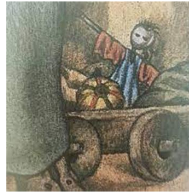
Görsel 6. Yaşantı I 1958

Kukla da çeşitli sahne gösterilerinde kullanılmak üzere yapılan ve insan eliyle hareket ettirilen figür, insan ve hayvan biçiminde figürlerdir. Kuklalar iki ya da üç boyutlu olabilir; el kuklası, sopalı kukla, tezgâh altından yönetilen gölge kuklaları ve "marionette" de denen ipli kuklalardır (Görsel 7). Kuklacılığın kökeni büyü törenlerine dayandırılabilir. Yazıyı bilmeyen ilkel insanların da kukla yaptıkları kesindir (turkedebiyati.org).