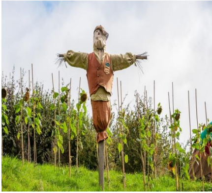
Görsel 4. Korkuluk

Korkuluk tarla, bağ ve bahçelerde kuşların zarar vermesini önlemek için konulan, insana benzer kukla (TDK) (Görsel 4). Belki anlamsal içeriğinden belki de estetik içeriğinden dolayı sanat çalışmalarına da sıklıkla yansıdığı görülmektedir. Neşet Günal'ın korkuluk resimleri (Görsel 5), sanatçının çocukluk yıllarına dayanan bağ, bahçe, tarlaları kuşlardan ve zararlı hayvanlardan korumak için yapılmış hayali, korkutucu kukla-insan imgelerinin resimlerine yansımasıdır (Arda, 2015). Bahçeleri koruma amaçlı yapılan bu kuklalara benzer korkunç figürler oyuncak olarak da karşımıza çıkmaktadır. Neşet Günal'ın "Yaşantı 1 resmine ait detayda (Resim 6) oyuncak korkuluk görülmektedir (Büyükkol, 2015). İlk yapılış amacından başka çocukların oyun nesnesi ya da sanat ürünlerinin imgesel anlatımı olarak karşımıza çıkmaktadır.