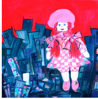
Görsel 2. "Bez bebek"