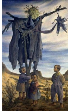
Görsel 5. Korkuluk II 1986