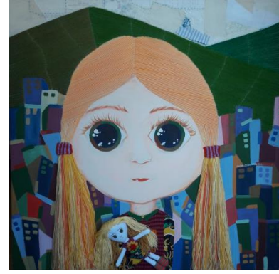
Görsel 3. "Renkli dünyamda Ben ve Bebeğim"

Korkuluk tarla, bağ ve bahçelerde kuşların zarar vermesini önlemek için konulan, insana benzer kukla (TDK) (Görsel 4). Belki anlamsal içeriğinden belki de estetik içeriğinden dolayı sanat çalışmalarına da sıklıkla yansıdığı görülmektedir. Neşet Günal'ın korkuluk resimleri (Görsel 5), sanatçının çocukluk yıllarına dayanan bağ, bahçe, tarlaları kuşlardan ve zararlı hayvanlardan korumak için yapılmış hayali, korkutucu kukla-insan imgelerinin resimlerine yansımasıdır (Arda, 2015). Bahçeleri koruma amaçlı yapılan bu kuklalara benzer korkunç figürler oyuncak olarak da karşımıza çıkmaktadır. Neşet Günal'ın "Yaşantı 1 resmine ait detayda (Resim 6) oyuncak korkuluk görülmektedir (Büyükkol, 2015). İlk yapılış amacından başka çocukların oyun nesnesi ya da sanat ürünlerinin imgesel anlatımı olarak karşımıza çıkmaktadır.