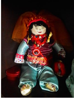
Görsel 1. "Annemin Bebeği"