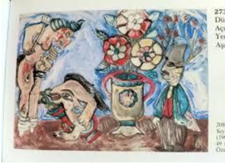
Resim 7. Seyirlik Figürler, Litografi, 49x63 cm (Cihat Burak, 1963).

Cihat Burak'ın, "Moby Dick" adlı diğer bir eserinde iki boyutlu bir etki kullandığı gözlenmektedir (R6). Minyatür etkisi bulunan bu resminde, hikâyeden bir sahne canlandırılmıştır. Karanlık ve kasvetli ortam ayın parlak ışığıyla biraz aydınlatılmıştır. Olayın etkisiyle korkan yaban kazları hızla oradan uzaklaşmaya çalışmaktadırlar. Mavinin yoğun olduğu resimde kırmızı renkteki yelkenli, resmin merkezini oluşturmuştur. Katil balina Moby Dick oldukça büyük çizilmiştir. Resimde karikatür etkisi, sanatçının mizahi yönünü göstermektedir (Özerakın, 2014: 47).