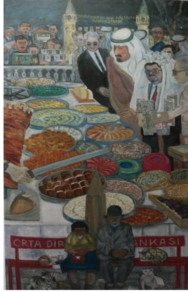
Resim 2. Sultan Sofrası, Tuval Üzerine Yağlıboya,89x49 cm (Cihat Burak,1984).

buket çiçek aslında bu anlatıya gönderme yapmaktadır. Resmin mekânsal ironik kurgusu tarihi bir anlatıyla bütünlenmiştir (Günbilen, 2009: 9-8).