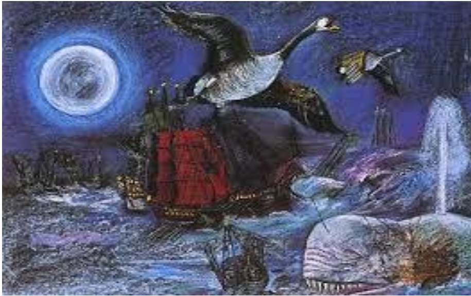
Resim 6. Moby Dick, Kâğıt Üzerine Yağlı Pastel, 48x66 cm (Cihat Burak, 1981).

“Cihat Burak, boya kullanımındaki üstün maharetiyle mahalli gerçekçiliğin çağdaş olanaklarına kavuşup, malzemeyi yoğurarak gerçeğin aslını arayan halk zevkini doğuruyor. Binanın duvarını örer, sıvasını çeker gibi kullanıyor yağlı boyayı; sabundan, elma, armut, şeftali döker gibi han-ı yağma sofrasını donatıp, boyadan kuş sütünü eksik bırakmıyor. Boyadan anılar döşeniyor, hayat boyasını ölüm çizgisiyle yarıyor. Boyadan insan yapıyor. Ağzı ve memeleriyle kadını yapıyor boyadan, adama boyadan yapılmak isteği veriyor. Cihat Burak’ın keskin ve şedit groteski gerçeğin aslını, yani olguyu kavrayan bilgeliğin yenilmez ve alçak gönüllü vizyonunu getiriyor. Gerçeğin bu yalnızdan esirgemediği halde harama kalktığı haz, yani anılarda zamanın ihanetine uğrayan yaşamının özü, onun yumuşak uysal ellerinde dize gelip, kahpeliklerinden arınıyor, biçim ve renk kazanarak boyun eğiyorlar. Çürüyen, eskiyen ruhu boyaya döküp, çürümez eskimez yapıyor Cihat Burak” (Tansuğ, 1986: 273).