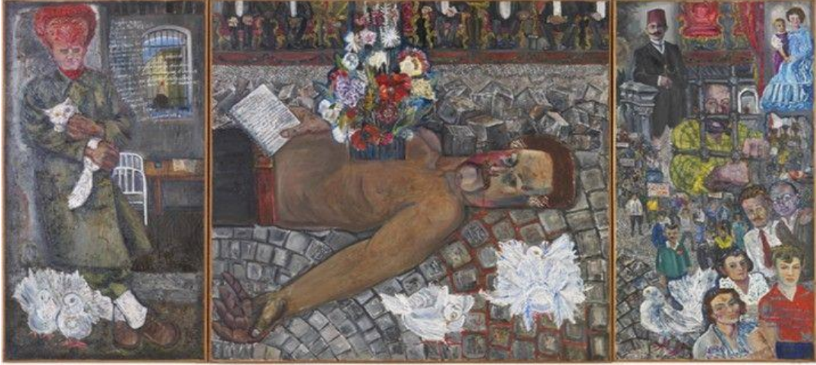
Resim 1. Şairin Ölümü, Tuval Üzerine Yağlıboya,140x280 cm (Cihat Burak,1967).