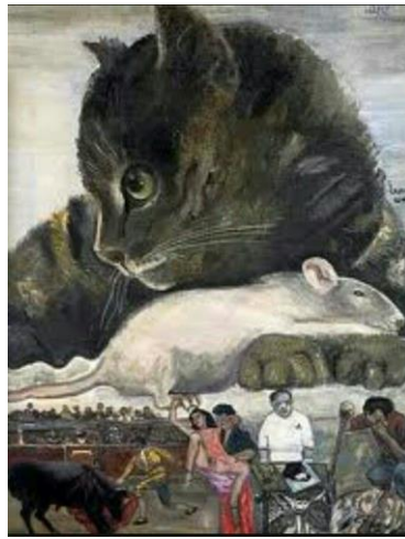
Resim 4. İnsanlar ve hayvanlar, Tuval Üzerine Yağlıboya, 81x65 cm (Cihat Burak,1984).

Efnan Atmaca, Cihat Burak'ın resimlerindeki günlük olayları aktarımını şöyle açıklamıştır; "Rönesans'ın iki büyük ustası Bosch ve Bruegel'in izinden giderek resimlerinde günlük yaşam içinde insanı, içinde bulunduğu toplumu ve onun değerlerini eleştiren, fantastik ve ayrıntıcı bir yorumla sorgulayan Burak, bu yönüyle de Türk resminde Rönesans'ın takipçisi oldu" (Atmaca, 2007: 47).