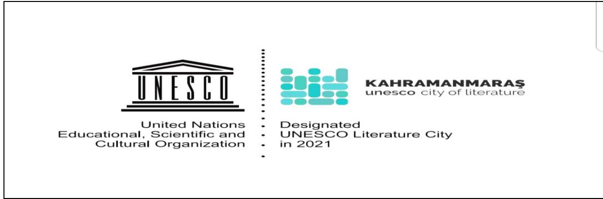
Şekil 1. UNESCO ve Kahramanmaraş Yaratıcı Şehirler Ağı Logoları (URL.4).

olduğunu, kültürel ve yaratıcı endüstriler kapsamındaki alanlarda ise az olduğunu göstermektedir (Özdemir ve Özdemir, 2020).