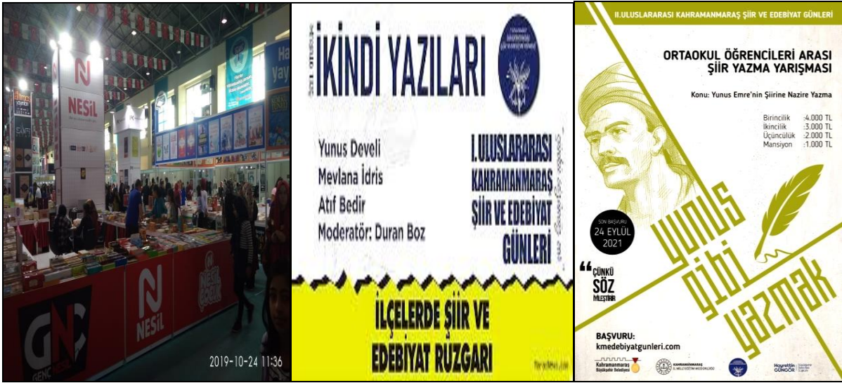
Fotoğraf 2. Kahramanmaraş Uluslararası Kitap Fuarı, Şiir ve Edebiyat Günleri Aktiviteleri

Almanya, Avusturya, Fransa, İngiltere, İtalya ve Litvanya'dan sonra Türkiye en fazla edebiyat müzesine sahip ülke sıralamasında 7. Sıradadır. Bu durum Türkiye'de de müzeciliğin özellikle de edebiyat müzelerinin gün geçtikçe geliştiği ve turizm anlamında hedef ortaya koyabileceklerini göstermektedir (Balcı ve Dilek, 2021).