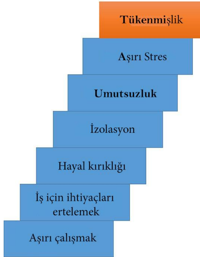
Şekil 1. Tükenmişliğe Etki Eden Faktörler (Nandkeolyar, 2019)

İşinde başarılı olmak için yüksek motivasyonlar çalışan iş görenlerde, yüksek beklenti ve amaçlar oluşabilmektedir. Yapılan araştırmalar yüksek beklenti ve ulaşılamayan hedeflerin tükenmişliği tetiklediğini ortaya koymuştur. Yüksek motivasyonlu çalışanlar hedeflerine ulaşmak ve başarıyı yakalamak için çoğu zaman kapasitesinin üzerinde çaba gösterir. Bu durum, tükenmişlik algısının ortaya çıkmasına neden olabilmektedir. Bazı araştırmacılar bu durumu göz önünde bulundurarak tükenmişliği sürekli başarıya duygusunun oluşturduğu baskının doğal bir sonucu olarak tanımlamaktadır (Thompson, 2009: 15). Başardığı her hedefin arkasına daha zor hedefler koyan birey, zamanla duyumsuzluk hissine kapılabilmekte ve bunun sonucunda tükenmişlik hissi yaşayabilmektedir.