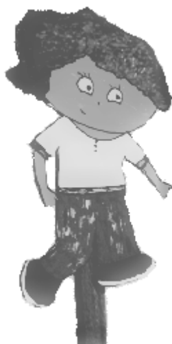
Image 1. The Puppet Used for Problem Statuses