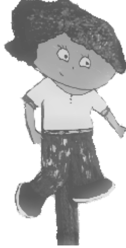
Görsel 1. Problem Durumları için Kullanılan Kukla

2015). Çocuklarla görüşme yapmadan önce araştırmacılar tarafından bir görüşme formu geliştirilmiştir. Öncelikle beş farklı problem durumu oluşturulmuştur. Problem durumlarının ana kahramanı olan Çiko adındaki çocuk için bir kukla tasarlanmıştır. Kukla, çocuklar için süreci daha keyifli hale getirmek ve çocukların daha rahat özdeşim kurmaları amacıyla oluşturulmuştur. Tasarlanan kuklanın yönlendirici olmaması için belirgin bir cinsiyet ayrımı yapılmamıştır. Ayrıca kuklada ifadesiz bir yüz olmasına dikkat edilmiştir (Görsel 1.).