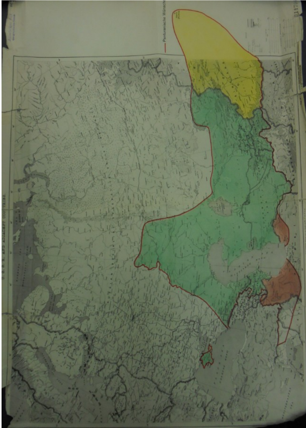
Resim 1. "Panturan Dilekleri", Kaynak: PA AA, R 29900, s. no yok.

Daha bir ay önce Ribbentrop' un Panturancılık hususunda "[...]Kafkasya' daki ve Hazar Denizi'nin doğusundaki Türk halklarına karşı Türkiye'nin tutumunun ne olacağına [...]" ilişkin Türkiye' nin Berlin Büyükelçisi Hüsrev Gerede'nin "[...]Türkiye' nin resmi politiasında sınırları dışında bir gayretinin olmadığını ve Panturan fikrinin Türkiye' de artık canlı olmadığı [...]" şeklindeki cevabını 22 (Kılıç, 2012:196) yalanlar şekilde, Nuri Paşa Woermann'a Atatürk'ün bu politikayı Sovyetler'e karşı duyduğu korkudan kaynaklanan bir motivasyonla