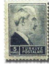
Resim 91. 1942