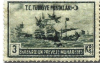
Resim 87. 1941

Ancak kanaatimizce İnönü dönemi diye adlandırabileceğimiz 1939-1950 yılları arasında basılan pulların en ilgi çekici yönlerinden birisi de Atatürk konulu pulların sayısında yaşanan azalmadır. 1941 yılı İnönü döneminde basılan pullarda bir dönüşümün yaşanmaya başladığı yıldır. Bu tarihten itibaren 1950 senesine kadar basılan pullarda Atatürk, sadece 4'ü at üstünde yer aldığı heykel figürü olmak üzere farklı fiyat ve yıllarda toplam 13 defa, İsmet İnönü ise bu yıllar arasında toplam 56 kez pullara konu edilmiştir.