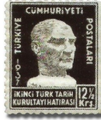
Resim 60. 1937