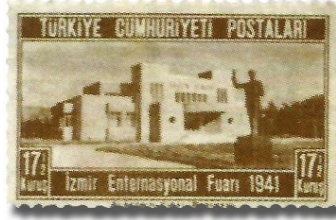
Resim 90. 1941