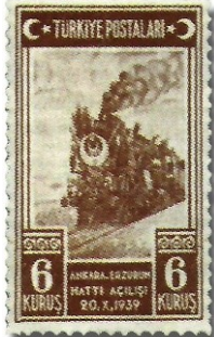
Resim 80. 1939