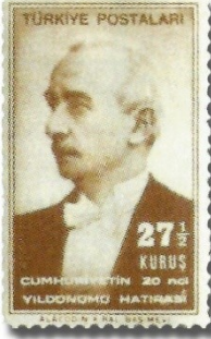
Resim 92. 1943