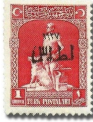
Resim 42. 1927