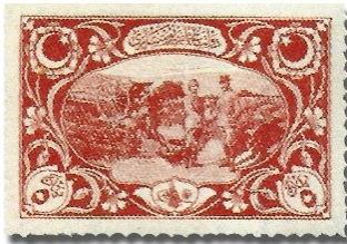
Resim 26. 1918