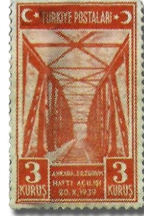
Resim 78. 1939