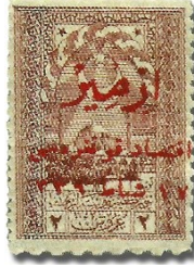
Resim 37. 1923