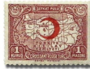
Resim 72. 1941

1939- 1950 Yılları Arası Posta Pulları: Atatürk'ün 10 Kasım 1938 tarihinde vefatının ardından, İsmet İnönü'nün cumhurbaşkanı olarak seçilmesi, posta pullarının içeriğinde de bir değişim ve dönüşümün yaşanmasına neden olmuştur. Bu süreç tek parti iktidarının sona erdiği 1950 senesine kadar devam etmiştir. Bu dönemin ilk pulu 21.11.1938 tarihli matem puludur. Aynı zamanda bu pul, Atatürk döneminin resmen sona erdiğinin ve İnönü döneminin başladığının da bir göstergesidir (Resim 73). Bu dönemde 1939 basımlı Amerika Birleşik Devletleri'nin bağımsızlığının 150. yılı (Resim 74, 75, 77) ve 1946 yılında Missouri savaş gemisinin İstanbul'u ziyareti münasebetleriyle hatıra pulları basılması (Resim 95), Türk - Amerikan ilişkilerinin geleceğine yönelik, Türk tarafının algısının izah edilmesi açısından önemli sayılabilir.