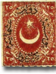
Resim 3. 1872