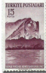
Resim 98. 1947