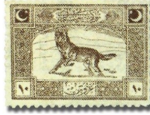
Resim 35. 1922