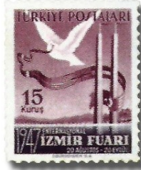
Resim 97. 1947