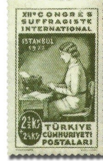
Resim 55. 1935