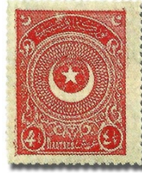
Resim 38. 1923