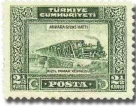
Resim 45. 1929