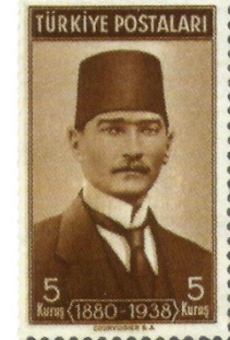
Resim 81. 1939

Bu dönemde basılan posta pulları, Osmanlı tarihine ait olayların “Preveze Deniz Savaşı” (Resim 87) ve kişilerin “Barbaros Hayreddin Paşa” (Resim 88) cumhuriyet döneminde konu edilmeye başlanması açısından önemlidir. Aynı zamanda Namık Kemal gibi Türk milliyetçisi olduğu bilinen bir kişinin konu edinildiği pullarında (Resim 82) bu dönemde basılmaya başlandığı görülmektedir.