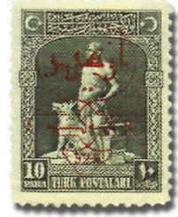
Resim 44. 1928

1929 yılından itibaren pullarda Osmanlıca'nın kullanımından tamamen vazgeçilmiş ve Latin alfabesine dayalı Türkçe yazı dili (Türkiye Cumhuriyeti, Posta ve Ankara-Sivas Hattı, Kızıl Irmak Köprüsü" ve "Ankara Kalesi, bakınız, resim 45-48) 6 kullanılmıştır (Ağaoğulları ve Papuççuoğlu, 2012: 147-156). Kısaca ifade etmek gerekirse bu tarihe kadar pullarda, bazen iki, bazen de üç yazı dili kullanılırken, 1929 yılından itibaren ekseriyetle kullanılan dil Türkçe'dir.