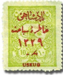
Resim 16. 1911