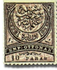
Resim 4: 1876