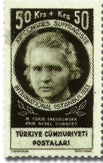
Resim 54. 1935