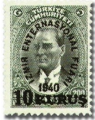
Resim 85. 1940