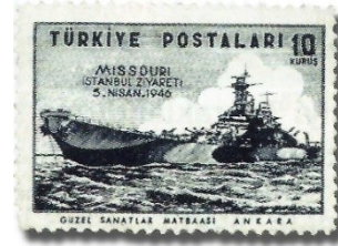
Resim 95. 1946