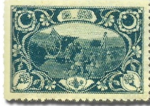
Resim 24. 1917