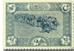
Resim 25. 1918