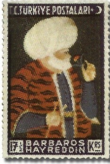
Resim 88. 1941