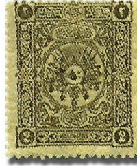
Resim 9. 1892