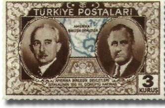
Resim 74. 1939