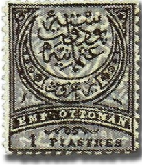
Resim 6. 1880