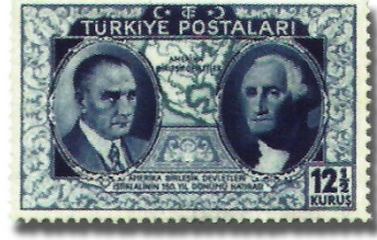
Resim 75. 1939