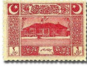
Resim 34. 1922