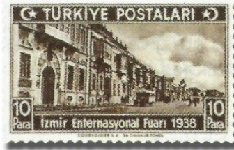
Resim 70. 1938