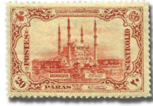
Resim 19. 1913

1914-1919 Yılları Arası Basılan Posta Pulları: Osmanlı tarihinde 1914 yılı, imparatorluğun yıkılmasına neden olacak, I. Dünya savaşının başladığı tarih olması açısından önemlidir. Bu tarihten itibaren ise basılan Osmanlı pullarında artık hükümdar portrelerinin 4 (Resim 20, 22) yer aldığı görülmektedir. Reid (1984), Osmanlı pullarında 1914 öncesinde insan resminin yer almamasının nedenini, bir İslam geleneği olarak insan resimlerinin çizilmesinin hoş karşılanmaması olarak izah etmektedir. Resim 21’te verilen pul ise bu dönemde basılan sürşarjlı pullara bir örnektir. Sayı itibariyle bu dönemde basılan sürşarjlı pulların sayısı, ilk basım pullardan daha fazladır. Bu durum devletin içinde bulunduğu ekonomik durumun bir göstergesi olması açısından kayda değer bir öneme sahiptir.