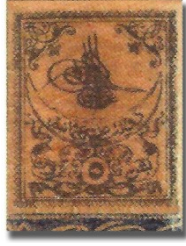
Resim 1. 1863

ekonomisinin kötü olduğu ve savaşların yaşandığı yılları içermesi açısından önemlidir. Aşağıda 1863-1913 yılları arasında Osmanlı Devleti tarafından bastırılan posta pullarından örnekler verilmiştir (Resim 1-19).