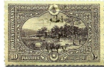
Resim 31. 1921