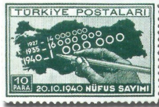
Resim 86. 1940