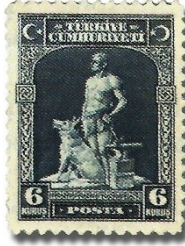
Resim 49. 1930