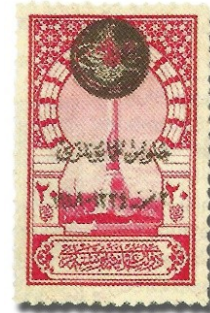
Resim 28. 1919

Pullara konu olarak bu dönem öncesinde sıklıkla yer verilen Osmanlı padişahlarının tuğra ve resimlerine, İttihat ve Terakki Partisi’nin hâkimiyeti altında geçen bu sürede, nadiren yer verilmiştir. Bu dönemde basılan posta pullarında, yakın dönem Türk tarihinin savaşlarla geçen olaylarına yer vermeye başlanması ve padişahın yerine Enver Paşa’nın resminin basılabildiği bir geçiş dönemi olma özelliği taşıması açısından da önemlidir.