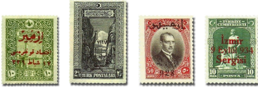
Resim 65. 1923