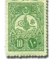
Resim 14. 1908

Bu dönemde pulların bir kısmının Avrupa'da basılması ve Avrupa'nın Osmanlı devleti üzerindeki etkisi nedeniyle bazı pullarda Osmanlıca'nın yanı sıra, İngilizce ifadelerin yer aldığı görülmektedir. Bu durum hem teknolojik, hem de siyasi açıdan devletin içinde bulunduğu durum hakkında yeterince bilgi vermektedir. Resim 14'de verilen pulun üzerinde "Meşrutiyet Hatırası" yazmakta ve 1908 yılında ilan edilen II. Meşrutiyet bir bakıma pullar vasıtasıyla umuma duyurulmaktadır. Bu dönem basılan pullardan elde edilebilecek diğer bir bilgi ise "kuruş" ve "para"nın o dönem Osmanlı devletinde para birimi olarak kullanıldığıdır.