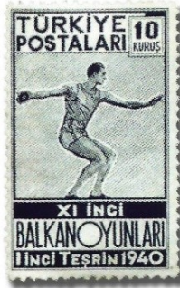
Resim 83. 1940