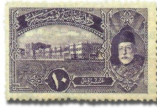
Resim 22. 1916