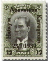
Resim 79. 1939