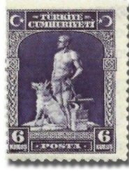
Resim 46. 1929