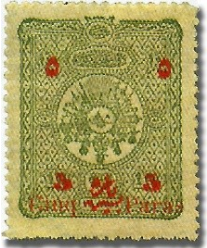
Resim 10. 1897