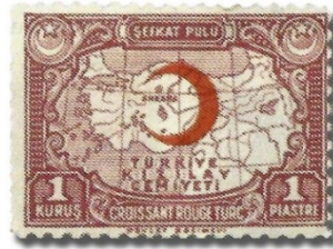
Resim 71. 1938