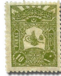
Resim 13. 1905