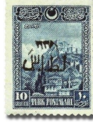
Resim 43. 1927