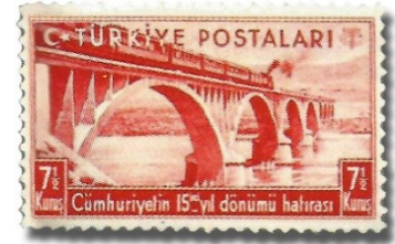
Resim 64. 1938

Resim 65-70'de verilen pullar, Atatürk'ün ülkenin tanıtımında ve ticari hayatında önemli bir araç olarak gördüğü, hali hazırda seksen iki kez düzenlenen, İzmir enternasyonal fuarı ile ilgili pullardır. İzmir Fuarı'nın geçmişi, ilki 17 Şubat 1923 yılında gerçekleştirilen İzmir İktisat Kongresi'ne dayanmaktadır. Kongrenin toplanacağı bilgisi 15 Şubat 1923 tarihinde basılan ve resim 65'de verilen sürşarjlı pulla kamuoyuna duyurulmuştur. İzmir enternasyonal fuarı konulu pullar, dönemin iktisadi faaliyetleri (ekonomiyi canlandırma) ve devletin yurt dışına açılma anlayışının izahı açısından değerlidir.