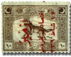
Resim 36. 1923