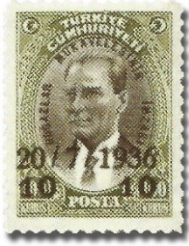
Resim 57. 1936