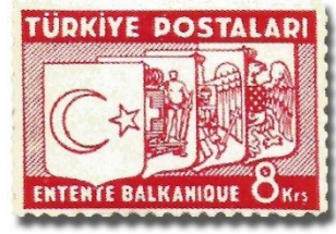
Resim 61. 1937