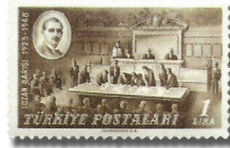
Resim 99. 1948

Tarafımızdan manidar olduğu ifade edilebilecek bir diğer pul ise, Demokrat Parti'nin iktidara gelmesinin ardından 1950 yılında basılan, üzerinde "14 Mayıs 1950 Hatırası" yazısının bulunduğu puldur (Resim 100). Bu pulla dolaylı olarak, İnönü döneminin bir bakıma Atatürk'ü unutturmaya çalıştığı ve demokrat partinin iktidara gelmesiyle birlikte başlayan yeni döneminin Atatürkçü bir bakış açısıyla şekilleneceğine yönelik resmi bir mesaj verilmeye çalışılmıştır.