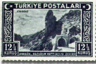
Resim 76. 1939