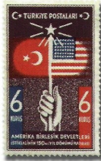
Resim 77. 1939