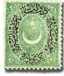
Resim 5: 1876