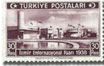
Resim 69. 1938