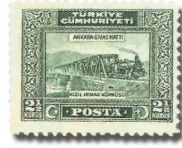
Resim 48. 1930