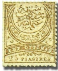
Resim 7. 1886