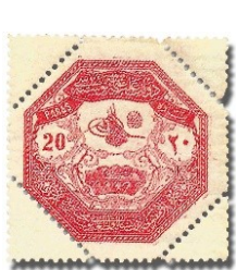
Resim 11. 1898