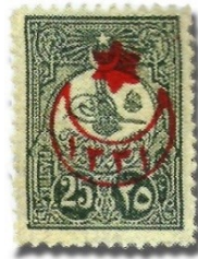
Resim 21. 1915