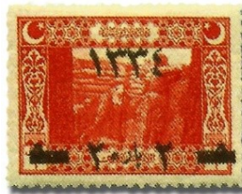
Resim 27. 1919