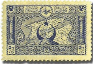
Resim 23. 1917

Resim 26’da gösterilen, ilk kez padişahın dışında bir kişinin konu edildiği 1918 tarihinde basılan pul ise, Türk pulculuk tarihinde ayrı bir yere sahiptir. Bu tarihte İttihat ve Terakki Partisi iktidardadır. Bu pulda konu edilen kişiler Enver Paşa ve Alman İmparatoru II. Wilhelm’dır. İttihat ve Terakki Partisi’nin en güçlü adamı Enver Paşa’nın, Osmanlı padişahının yer alması gereken bir pulda, II. Wilhelm’le birlikte resmedilmesi, devleti elinde tutan gücün kim olduğunu ifade etmesi açısından önemlidir. Resim 28’de verilen pul ise Sultan Vahdettin’in cülusu konuludur. Bu pul, posta pullarının devletin yönetiminde meydana gelen değişiklikleri de içerdiğinin bir göstergesidir.