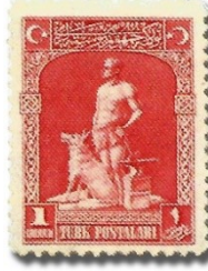
Resim 41. 1926