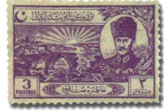
Resim 39. 1924