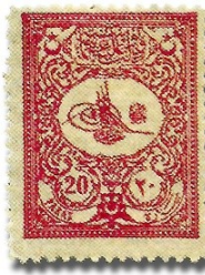
Resim 12. 1901