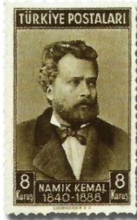
Resim 82. 1940

Bu dönemde 1 Ekim 1940 tarihinden başlamak üzere, 21 Ekim 1945 ve Demokrat Parti döneminde (9 Ekim 1950) de devam eden bir uygulama olarak yaklaşık her beş yılda bir “Nüfus Sayımı” konulu pullar basılmıştır (Resim 86). Dönemin marşlarında bile nüfusun artması vurgusunun yer aldığı düşünülürken, bu tür pullar ile yeni Türk devletinin savaşlarla kaybedilen nüfusunun arttığı bilgisinin propaganda amaçlı olarak iç ve dış kamuoyu ile paylaşıldığı görüşü ileri sürülebilir.