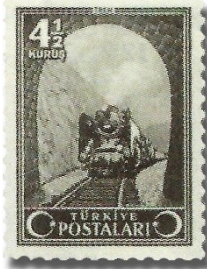
Resim 93. 1943