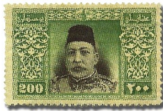
Resim 20. 1914

1914-1919 Yılları Arası Basılan Posta Pulları: Osmanlı tarihinde 1914 yılı, imparatorluğun yıkılmasına neden olacak, I. Dünya savaşının başladığı tarih olması açısından önemlidir. Bu tarihten itibaren ise basılan Osmanlı pullarında artık hükümdar portrelerinin 4 (Resim 20, 22) yer aldığı görülmektedir. Reid (1984), Osmanlı pullarında 1914 öncesinde insan resminin yer almamasının nedenini, bir İslam geleneği olarak insan resimlerinin çizilmesinin hoş karşılanmaması olarak izah etmektedir. Resim 21’te verilen pul ise bu dönemde basılan sürşarjlı pullara bir örnektir. Sayı itibariyle bu dönemde basılan sürşarjlı pulların sayısı, ilk basım pullardan daha fazladır. Bu durum devletin içinde bulunduğu ekonomik durumun bir göstergesi olması açısından kayda değer bir öneme sahiptir.