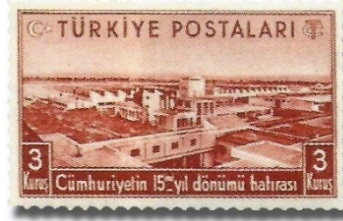
Resim 63. 1938