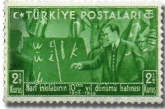
Resim 62. 1938