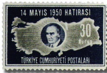
Resim 100. 1950

Tarafımızdan manidar olduğu ifade edilebilecek bir diğer pul ise, Demokrat Parti'nin iktidara gelmesinin ardından 1950 yılında basılan, üzerinde "14 Mayıs 1950 Hatırası" yazısının bulunduğu puldur (Resim 100). Bu pulla dolaylı olarak, İnönü döneminin bir bakıma Atatürk'ü unutturmaya çalıştığı ve demokrat partinin iktidara gelmesiyle birlikte başlayan yeni döneminin Atatürkçü bir bakış açısıyla şekilleneceğine yönelik resmi bir mesaj verilmeye çalışılmıştır.