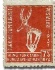
Resim 59. 1937