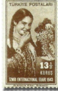
Resim 94. 1943