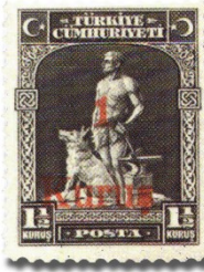
Resim 50. 1931