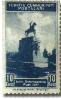
Resim 89. 1941