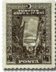
Resim 58. 1936