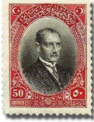
Resim 40. 1926