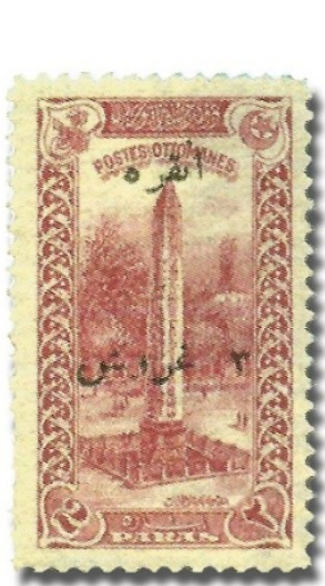
Resim 29. 1920

1922 basımlı pulların her biri, Türk tarihi açısından ayrı bir öneme sahiptir. Resim 32'de verilen pul Osmanlı Devleti tarafından basılan ve piyasaya sürülen son puldur. Resim 33'te verilen TBMM Hükümetinin bastığı pulda ise ilk defa Anadolu toprakları bir pul üzerinde resmedilerek, Anadolu'nun Türk toprağı olduğu düşüncesi propaganda amaçlı olarak kullanılmıştır. Aynı pulda resmedilen coğrafi alanda Misak-ı Milli sınırları içerisinde kalan yerlerin, isim verilmeden gösterilmesi de tarafımızca manidar bir uygulama olarak karşlanmaktadır. Resim 34'te verilen pulda ise, Ankara'da açılan Türkiye Büyük Millet Meclisi binası resmedilerek egemenliğin meclise geçtiği mesajı verilmeye çalışılmıştır. Basılan pullar içerisinde Bozkurt resminin yer aldığı ve resim 35'te bir örneğinin verildiği pul; içeriği daha sonra şekillenecek olan devletin siyasi, kültürel ve sosyal bakış açısının nasıl olacağına yönelik bir mesaj vermesi açısından önemlidir.