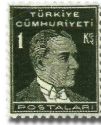
Resim 52. 1931