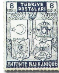
Resim 84. 1940