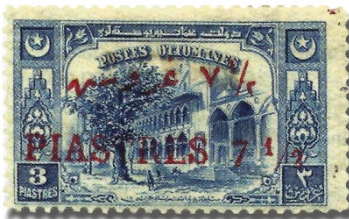
Resim 32. 1922