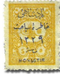
Resim 18. 1911