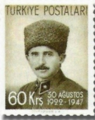
Resim 96. 1947