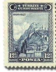
Resim 47. 1929