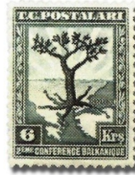
Resim 51. 1931