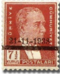
Resim 73. 1938

Resim 81’de verilen pulun üzerinde Atatürk’ün doğum tarihi 1880 olarak ifade edilmiştir. Fakat yapılan araştırmalar sonucunda Atatürk’ün doğum tarihinin 1881 olduğu ispatlanmıştır (Güler, 1999; Yazıcı, 2010). Bu nedenle pullar üzerindeki bilgilerin güncel araştırma sonuçlarında bir değişikliğe uğrayıp uğramadığının da kontrol edilmesi gerekmektedir. Ancak bu pul, basıldığı dönemde Atatürk’ün doğum tarihinin hangi yıl olarak bilindiğinin anlaşılması açısından kayda değer bir öneme sahiptir.