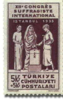
Resim 56. 1935

Resim 57 ve 58 de sürşarjlı olarak piyasaya sürülen pulların üzerinde Montrö Boğazlar Sözleşmesi'ne atfen "Boğazlar Mukavelesinin İmzalanması 20/7/1936" bilgisi yer almaktadır. 1937 yılında basılan "İkinci Türk Tarih Kurultayı" konulu pullar ile Türk Tarih tezinin, hem duyurulması sağlanmış hem de devlet politikası halini aldığı bir göstergesi olmuştur (Resim 59-60). Aynı yıl basılan, yaklaşan II. Dünya savaşı tehlikesi nedeniyle bölgenin güvenliğinin sağlanması amacıyla Balkan devletleri arasında imzalanan antlaşmanın yer aldığı "Balkan Antantı" konulu pul, Türk tarihinde bir anlaşmanın pullara konu edinilmesinin, ilk örneği olması açısından önemlidir (Resim 61). 1938 yılında basılan pullarda ise, cumhuriyet döneminde yapılan yenilikler konu edilmiştir. Harf İnkılabının (Resim 62), sanayileşme çalışmalarının (Resim 63) ve tarımda makineleşmenin ele alındığı (Resim 64) pulların propaganda amaçlı basıldığı görüşü ileri sürülebilir.