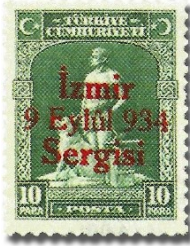
Resim 53. 1934