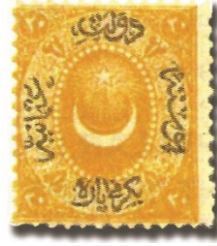
Resim 2. 1865