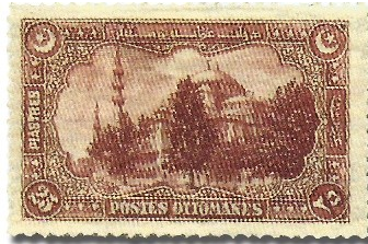
Resim 30. 1920