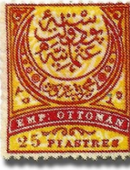
Resim 8. 1888