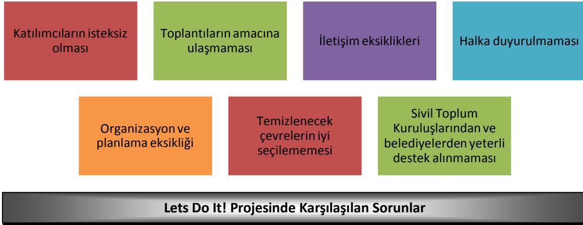
Şekil 4: Öğretmen Adaylarına Göre Projede Karşılaşılan Sorunlar

Araştırmaya katılan öğretmen adayları katılım gösterdikleri Let's Do It! projesine ilişkin çeşitli sorunlar yaşadıklarını dile getirmişlerdir. Bu sorunlar Şekil 4'te gösterilmiştir.