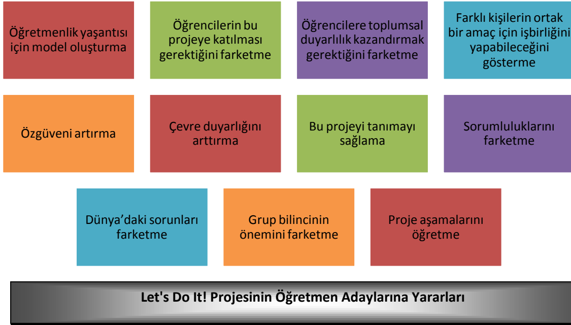
Şekil 2: Öğretmen Adaylarına Göre Let's Do It! Projesinin Yararları

Araştırmaya katılan öğretmen adayları Let's Do It! projesine katılmanın kendilerine bir takım yararları olduğunu düşünmektedir. Öğretmen adaylarının büyük bir bölümü projeye katılımın yararlarını, eğitimini gördükleri öğretmenlik mesleği bakımından açıklamışlardır. Öğretmen adaylarının bu projeye katılmalarının kendilerine yararları ile ilgili bulgular Şekil 2'de gösterilmiştir.